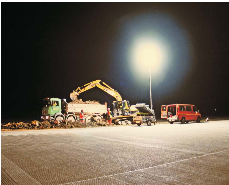
Lumitrail 4000 - in Arbeit

Wie beraten Sie gerne für andere Modelle bzw. Ausführungen